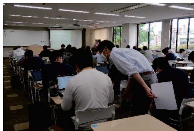
図 7 グループ演習時の机間巡回