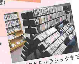
J-POPからクラシックまで 1,400点もの CD