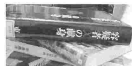
研究室のテーブル上で発見「文芸書もよく読みます」