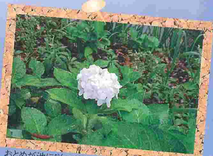
おとめが池に咲いた美しくも珍しい純白のアジサイ

7月18日(火)～9月16日(土)まで、学部生へ夏季休暇中の長期貸出を行います。返却はすべて10月2日(月)となります。貸出期間が長いので返却を忘れないように気をつけてください。