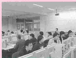
講師の説明に熱心に耳を傾け…