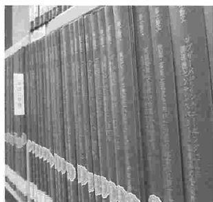
研究の成果、修士・博士論文