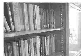
書棚には物理・数学関係の洋書がズラリ

図書館に行くたび、文芸書の棚はひと回りチェックするという郷六先生。これからもたくさん図書館をご利用ください。心よりお待ちしております。