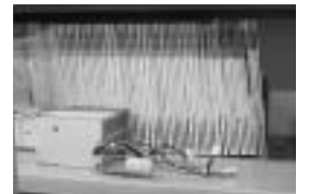
バックナンバーまでズラリの 電気学会誌・論文誌

研究に興味に、多彩に揃った本棚を拝見でき、先生の新たな魅力を発見した訪問となりました。