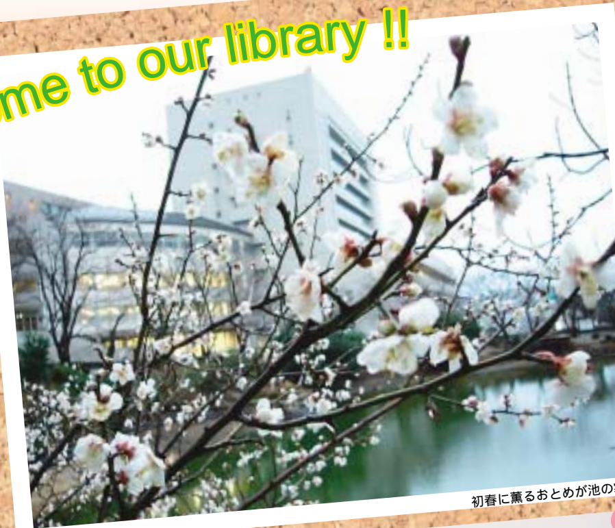
初春に薫るおとめが池の寒梅