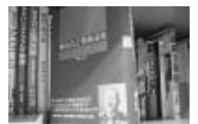
心待ちにして買った 「秋山真之戦術論集」