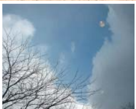
冬の合間の青い空