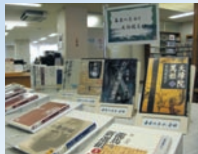
坂本龍馬や新撰組などが活躍した激動の時代

そこで、10月～11月は、『幕末の志士と篤姫』と題して激動の時代を生きた志士たちの人物像を描いている作品を中心に集めてみました。展示コーナーは図書館入退館ゲートを通過すると目の前にあります。