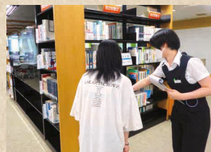
個人申込の 図書館利用オリエンテーション

Fukuoka Institute of Technology 附属図書館 FIT 福岡工業大学 短期大学部 附属図書館