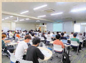
100名参加の 文献検索オリエンテーション