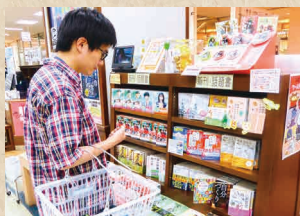
店舗での選書の様子