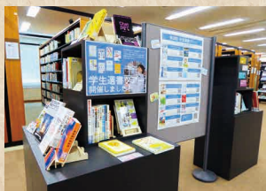
図書館4F 選書ツアー展示コーナー